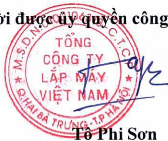
Tô Phi Sơn